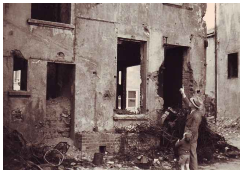
Nach dem Luftangriff auf Wuppertal im Sommer 1943: Auch die Geschäftsräume der Schneiderei Burscheid sind völlig zerstört.