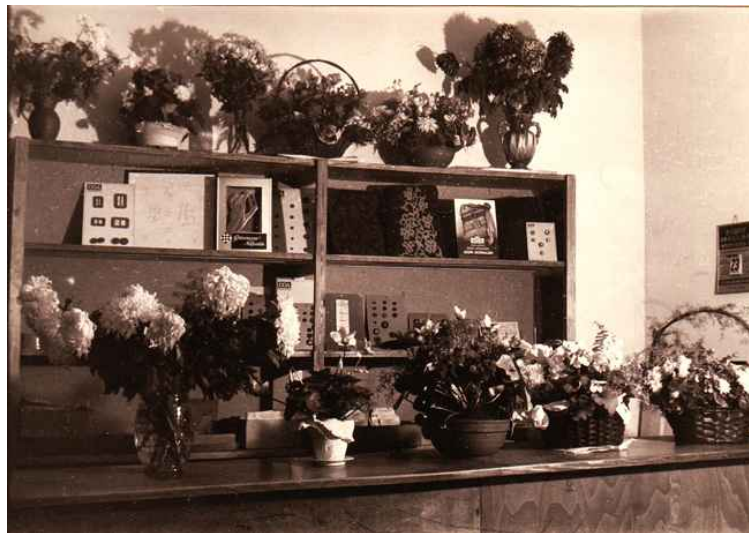
Vielen Dank für die Blumen! Nach der Wiedereröffnung am 20. November 1950 empfing die Schneiderei Burscheid hier ihre Kunden.